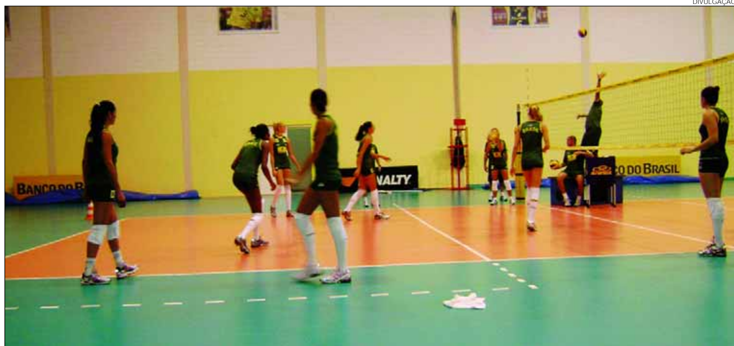
Colegiado pretende estimular o apoio da iniciativa privada aos atletas e às competições esportivas realizadas no Estado

"Na OAF, oferecemos oficinas de reforço escolar, música e contação de história, além de alimentação. Temos projetos em parceria com o Banco do Brasil e Caixa Econômica, atendendo cerca de 250 crianças. Funcionamos como o segundo expediente da escola. Também firmamos parceria com o Conservatório Pernambucano de Música para ministrar aulas e descobrir novos talentos, e com a Celpe, por meio do Projeto