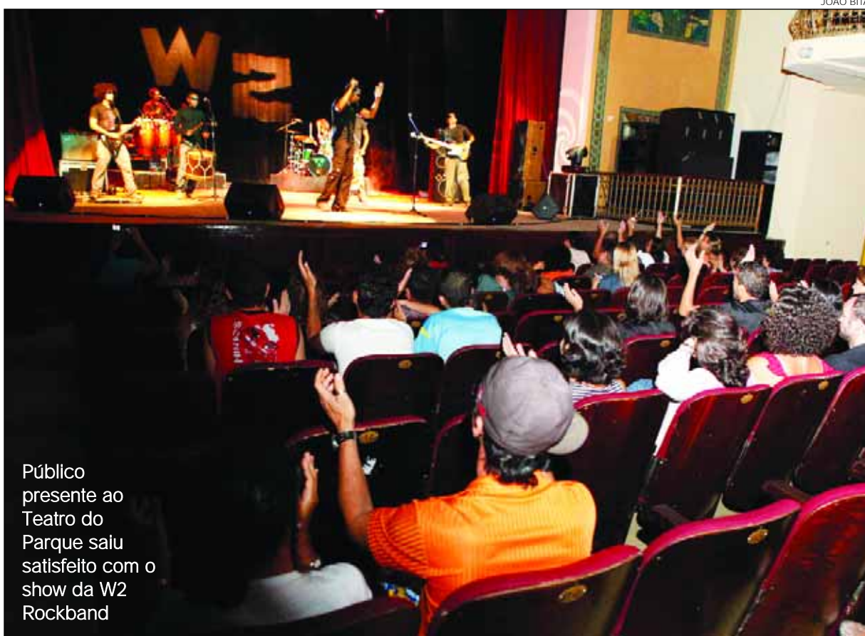
Público presente ao Teatro do Parque saiu satisfeito com o show da W2 Rockband