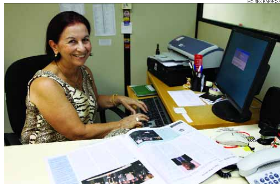
Além do trabalho na ONG, funcionária também atua no Sindicato dos Servidores

Além de presidir a OAF no Recife, a advogada também faz parte da diretoria do Sindicato dos Servidores da Assembleia