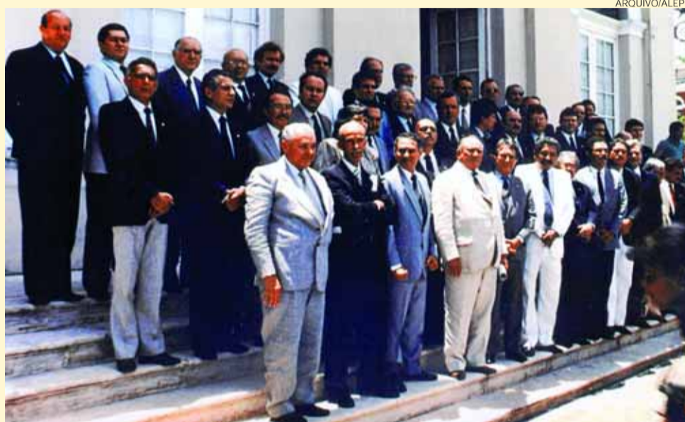
Os deputados constituintes posam para foto histórica em frente à Alepe