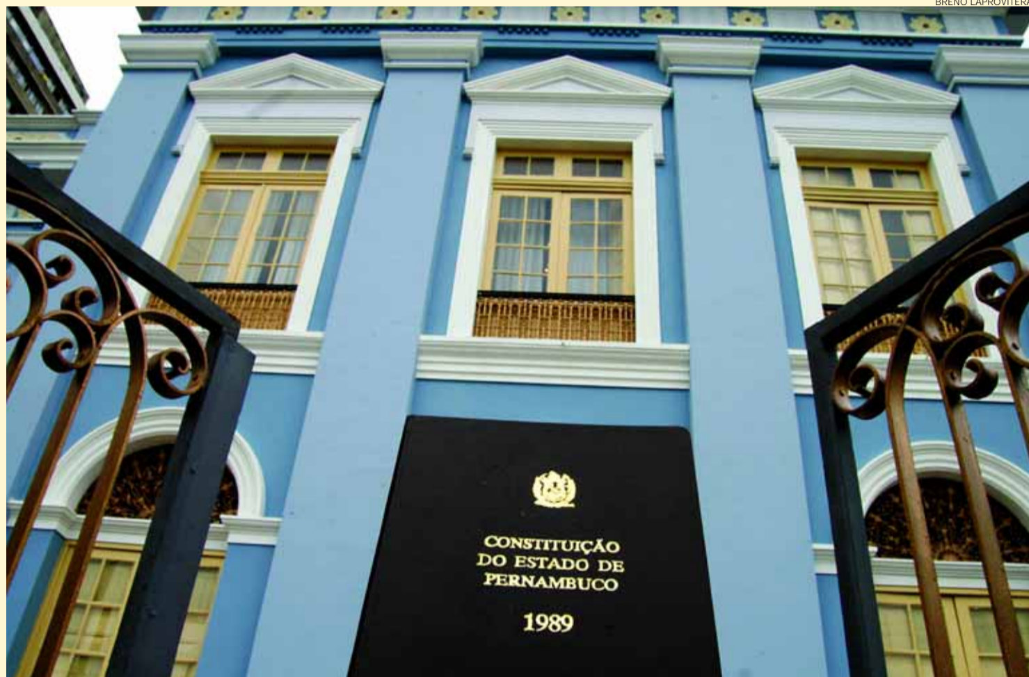
A promulgação da Lei Maior de Pernambuco simbolizou a reabertura da Casa Joaquim Nabuco para a participação popular

Vários avanços foram elencados pelo juiz: o disciplinamento do sistema tributário estadual; a organização do Poder Legislativo; a definição das competências do Executivo e Judiciário; as regras para criação dos municípios; o fortalecimento das políticas ambientais; e a criação dos Conselhos da Criança e do Adolescente, do Meio Ambiente e da Cultura. Para o especialista, o principal benefício trazido pelo texto pernambucano foi o fortalecimento do Estado. Entretanto, a política ambiental foi destacada por ele como um dos pontos mais fortes, "porque começou a haver a necessidade de resguardar recursos hídricos e definir o que é terreno do Estado".