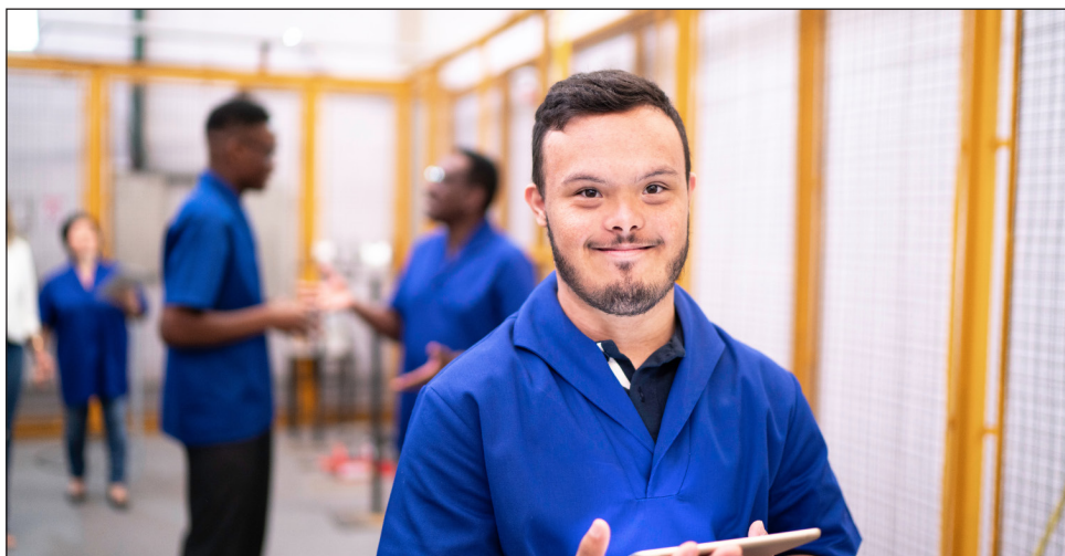
INCLUSÃO – Acesso à educação e saúde amplia autonomia e participação social

O dia 21 de março (21/3) é dedicado à conscientização global sobre a síndrome de Down. Oficializada pela Organização das Nações Unidas (ONU) em 2012, a data simboliza a trissomia do cromossomo 21 — alteração genética que caracteriza a síndrome. O objetivo é reforçar a importância da inclusão, da igualdade de oportunidades e do respeito à diversidade. Na Alepe, esse compromisso se traduz em ações, leis e apoio contínuo.