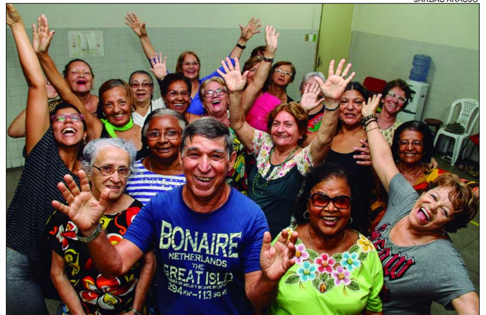
PROGNÓSTICO - Garantir qualidade de vida é caminho apontado por estudiosos. Na foto, alunos de dança do Sesc