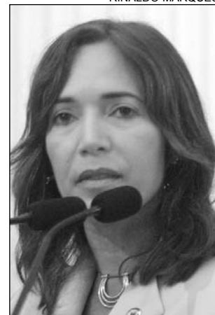
AÇÃO - Elogio da socialista