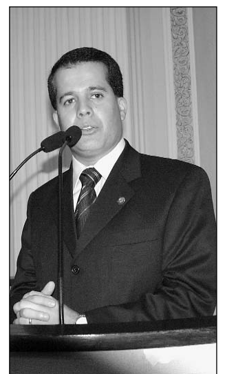
VIEIRA - Explicações

O socialista-cristão registrou que as benfeitorias