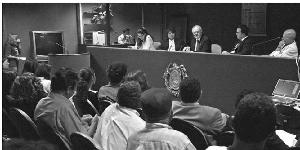
SAÚDE -Presidente e primeiro-secretário da Casa participaram do lançamento do programa