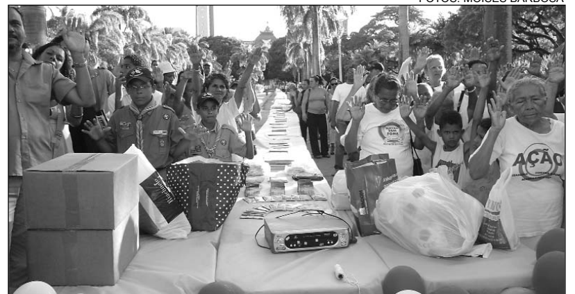
ORAÇÃO - Público presente pediu paz ao redor da mesa de 300 metros

transparente, com ética e em nome dos necessitados". A Casa Joaquim Nabuco participa do Natal sem Fome desde 1998. Também estiveram ao ato a conselheira do TCE-PE Teresa Duere; além de representantes do governo do Estado e da Prefeitura da Cidade do Recife.