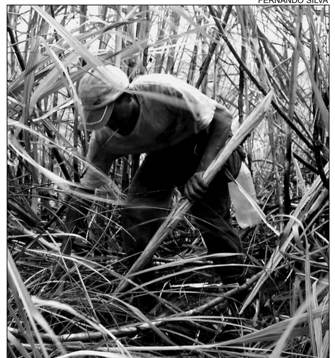
SALÁRIO - Cerca de quatro mil empregos diretos

atletismo. Tais iniciativas aumentam a expectativa de vida dos moradores que, hoje, contam com uma condição bem melhor", observou.