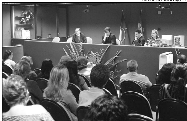
CAMPANHA - Financiamento público é uma das propostas

porte podem não conquistar a eleição", alertou.