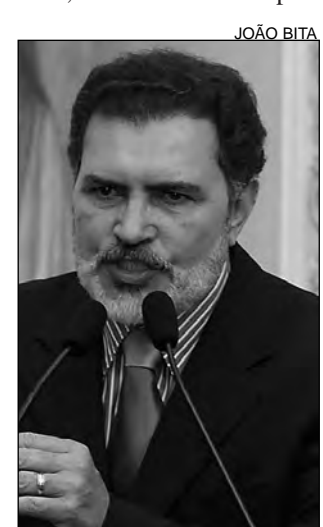
GEL - Esclarecimentos

ções do próximo ano, se possível, com candidatos pró-