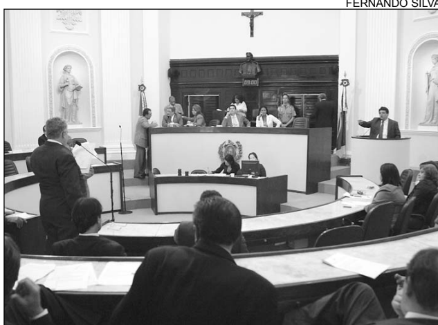
COSTA - Deputado usou a tribuna para questionar iniciativa

"O Prodepe é a grande caixa preta do Governo. Ele dá prejuízo financeiro ao Estado, pois protege os grandes empresários que não são cobrados pelo