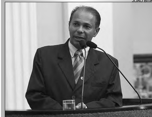
BRAZ – Exemplo de coragem do ex-vice-presidente

Segundo o parlamentar, as cidades de Vicência, Macaparana, Sanharó, Aliança e Catende passarão, ainda este ano, por processo semelhante ao da Capital do Agreste. “É importante que as pessoas procurem os cartórios eleitorais, o mais cedo possível, para não serem impedidas de votar. É necessário levar carteira de identidade ou profissional, juntamente com o título de eleitor, no momento do recadastramento”, ressaltou o integrante do Democratas.