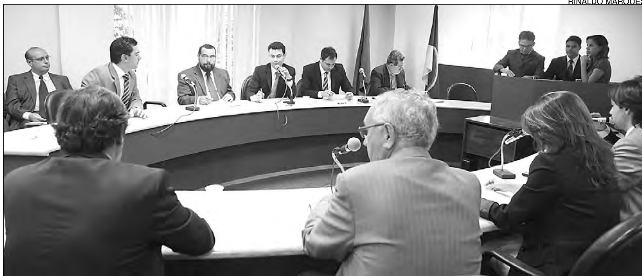
GRUPO B - Atacado, varejo de açúcar, bebidas e outros foram os mais rentáveis, contribuindo com R$ 5,3 bilhões

Os segmentos do Grupo B (atacado, varejo, usinas de