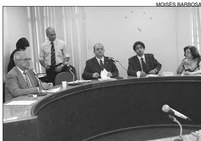
ARGUMENTO - Combina limpeza e ação microbicida

O produto é indicado para higiene diária, apresentando alto poder de limpeza, combinado com uma capacidade microbicida extremamente eficiente contra larga escala de microorganismos. Vale lembrar que, para desinfecção instantânea das mãos, não é necessário água. “Além disso, o uso do gel sanitizante é uma das formas de economizar água, dinheiro e combater a proliferação de bactérias”, destacou o texto.