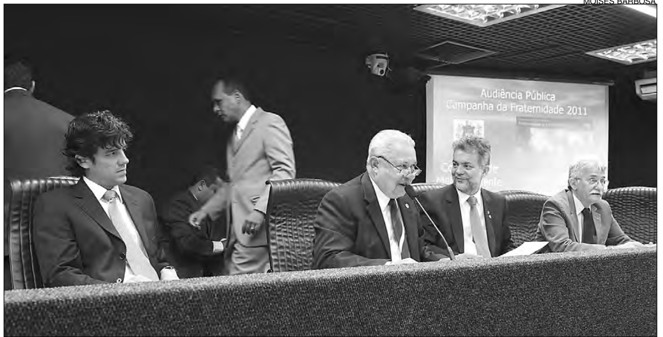
ECONOMIA – Sem atenção às riquezas naturais, não haverá desenvolvimento sustentável a longo prazo