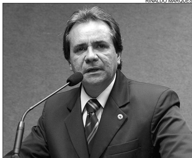
SANTANA - Cidade completa 163 anos com problemas

Os 163 anos de emancipação política de Ipojuca, no Litoral Sul, foram comemorados, ontem, pelo deputado Carlos Santana (PSDB). O parlamentar destacou a história e a importância econômica da cidade para o Estado e disse que, de todas as ações empreendedoras que acontecem atualmente em Pernambuco, a maior parte está localizada na região. “Os projetos estruturais vão alavancar não só a economia de Pernambuco, mas a do Nordeste”, ponderou.