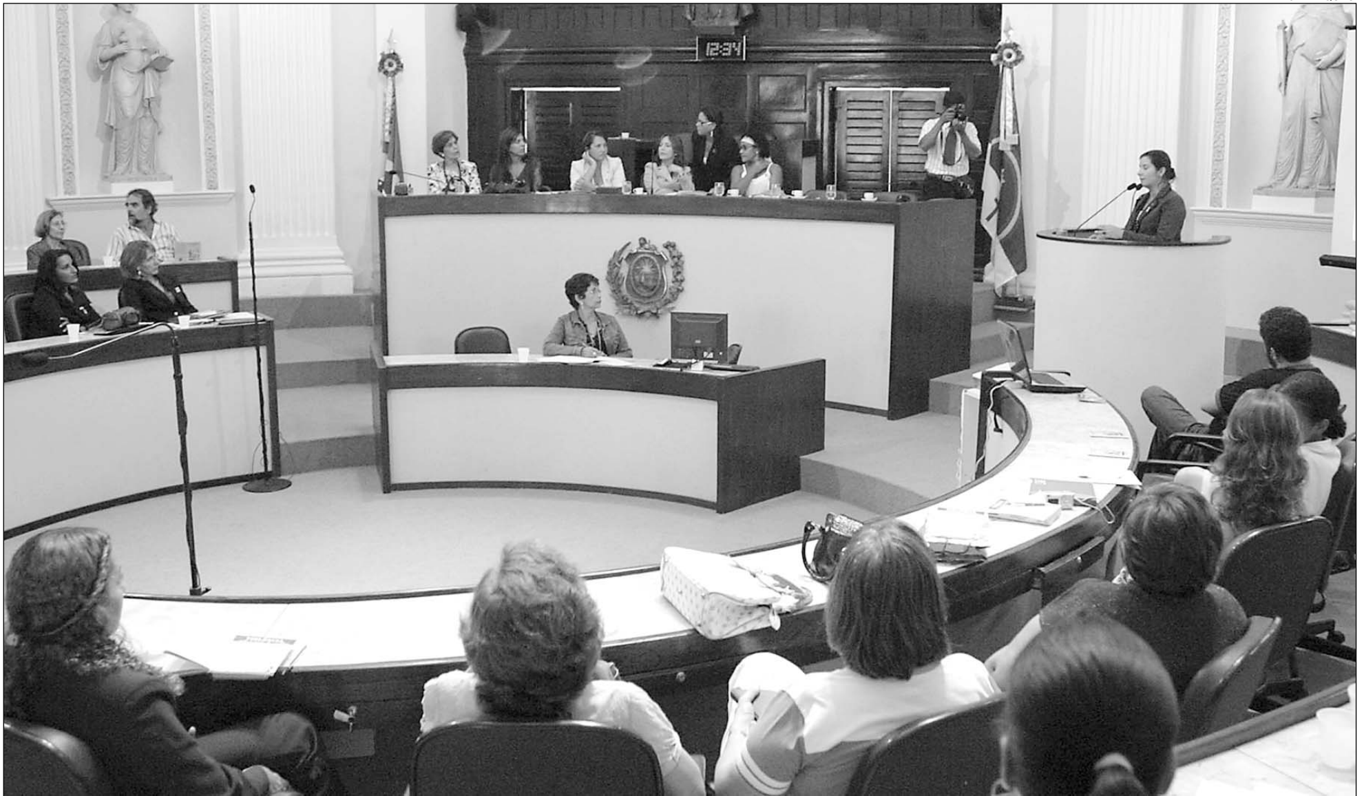
AVALIAÇÃO - Parlamentares, secretários e representantes de ONGs alertaram que os casos em que a vítima é do sexo feminino envolvem pessoas de diferentes classes sociais