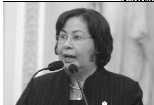
AÇÃO -Parlamentar recebeu elogios dos demais deputados

De acordo com a parlamentar, o curto mandato foi extremamente produtivo, com uma convivência harmônica entre os integrantes da Oposição e do Governo. "Aliando o significado da palavra Assembléia, que representa união, às virtudes da ética, cidadania e dignidade, valores que sempre mediei para cumprir a função de parlamentar, participando ativamente das Comissões, audiências públicas e reuniões