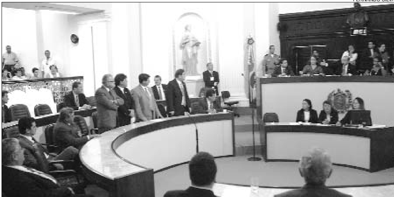
REAJUSTE - Projeto que trata do aumento salarial para servidores da administração direta foi acatado em segunda discussão