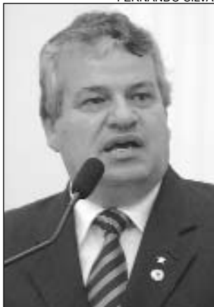
HABITAÇÃO - Precária