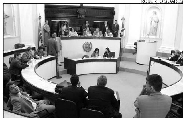
DEBATE - Matéria que beneficia TJPE também foi acatada

Segundo Leite, há algumas imperfeições que precisam ser corrigidas e a emenda possibilitará que a proposta seja aplicada conforme a categoria deseja. "O Governo enviou uma emenda, mas não foi suficiente para corrigir as falhas existentes. Sem as alterações pode não ser possível a aplicação da lei. Faço um apelo a todos os deputados