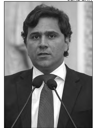
PRODUÇÃO - Novaes

De acordo com o deputado, a Conab só mantém polo de distribuição e venda