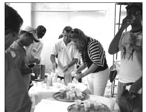
LANCHE - Reposição das energias