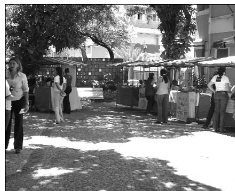
CRIATIVIDADE - Feirinha de talentos