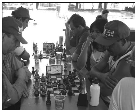
XADREZ - Concentração nos tabuleiros