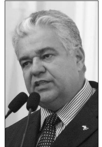
DESTAQUE - Moraes

"O empresário iniciou a trajetória empresarial ainda criança, trabalhando na seção de etiquetas da Fábrica de Linhas da Pedra, no industrial Delmiro Gouveia, em Paulo Afonso. No início da década de 20, voltou a Pernambuco, concluiu o curso ginásial e formou-se em Ciências Econômicas. Após superar sucessivas etapas, passou de empregado a patrão, de desconhecido a industrial famoso", ressaltou, frisando que a vida profissional do empresário como usineiro, fabricante do Cimento Nassau e de papel e sacos, na Fábrica Portela,