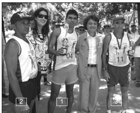
CORRIDA - Vitória nos sete quilômetros