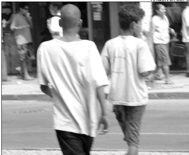
JUVENTUDE - Alvo principal da ação de traficantes