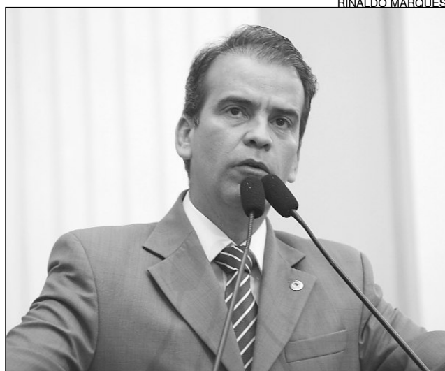
FEITOSA - Gestão comprometida com interesses sociais

“Apesar dos poucos anos, a localidade é bem estruturada. As ruas estão devidamente asfaltadas, as escolas funcionam e todo o