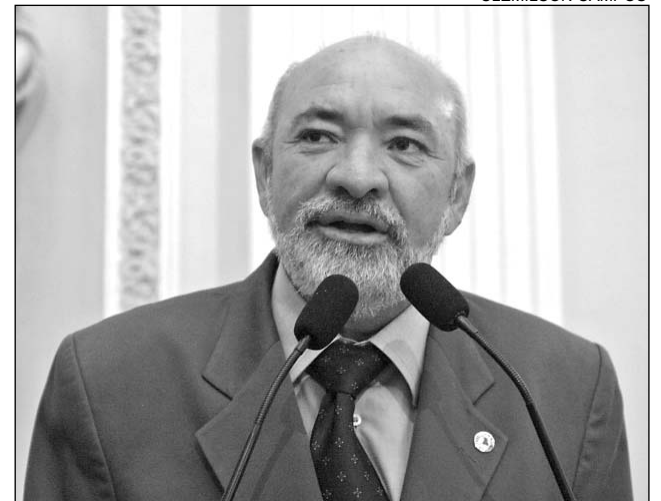
ESMERALDO - Incentivar cuidados com a saúde

O Instituto Nacional do Câncer (Inca) lançou