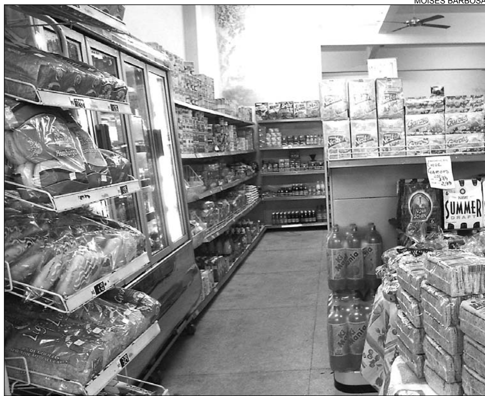
OBJETIVO - Idéia é esclarecer os consumidores sobre como se estabelece o preço

A próxima reunião dos parlamentares vai acontecer na terça-feira (4), a partir das 9h30. Na ocasião, será apreciados os pareceres das emendas aos Projetos do Plano Plurianual (PPA) 2008/2011 e da Lei de Diretrizes Orçamentárias (LDO) para 2008. A mudança na data foi anunciada, ontem, pelo presidente da Comissão, deputado Geraldo Coelho (PTB), após acordo com os demais integrantes do colegiado.