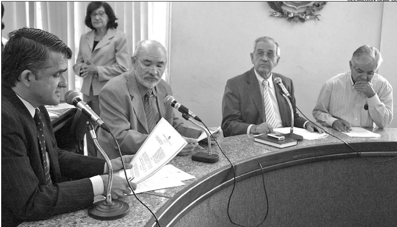
ACÇÕES - Rede PE-Multidigital, serviços de média e alta complexidades e o Lacen serão alguns dos beneficiados