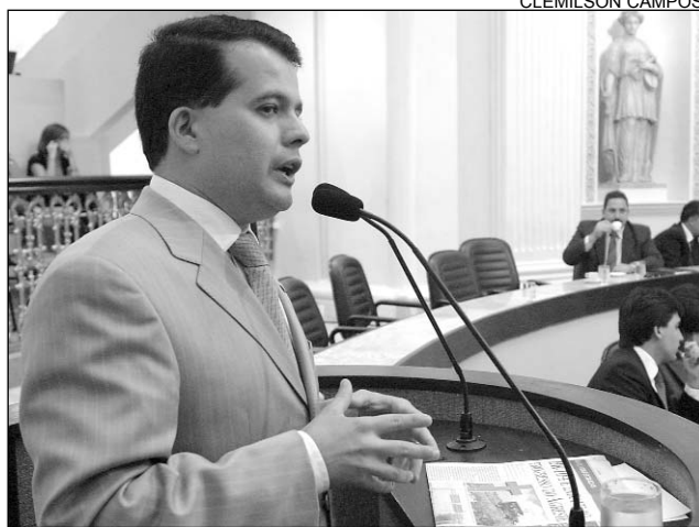
URGÊNCIA - Alerta para possibilidade de acidentes

De acordo com o parlamentar, a reportagem do JC revela que o Pólo de Confecções do Agreste espera pela duplicação da rodovia para crescer mais, superando os 80 mil empregos que são gerados atualmente. "É preciso que juntemos forças para cobrar