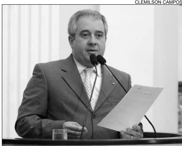
COUTINHO - Algumas cobranças inviabilizam empresas

O Decreto nº 30.721/07, assinado pelo governador Eduardo Campos (PSB), no último dia 18, alterando o sistema de recolhimento de impostos no Estado, foi criticado ontem pelo deputado Augusto Coutinho (DEM). De acordo com o parlamentar, a medida modifica outro decreto estadual publicado em julho de 2007, que previa condições especiais de parcelamento de débito de ICMS para o contribuinte que optasse pelo Simples Nacional. "A mudança na legislação traz prejuízos aos pequenos empresários, uma vez que eles estão recebendo da Secretaria Estadual da Fazenda cobranças acumulativas, de anos anteriores, com o prazo de pagamento sem multa até hoje (30)", frisou.