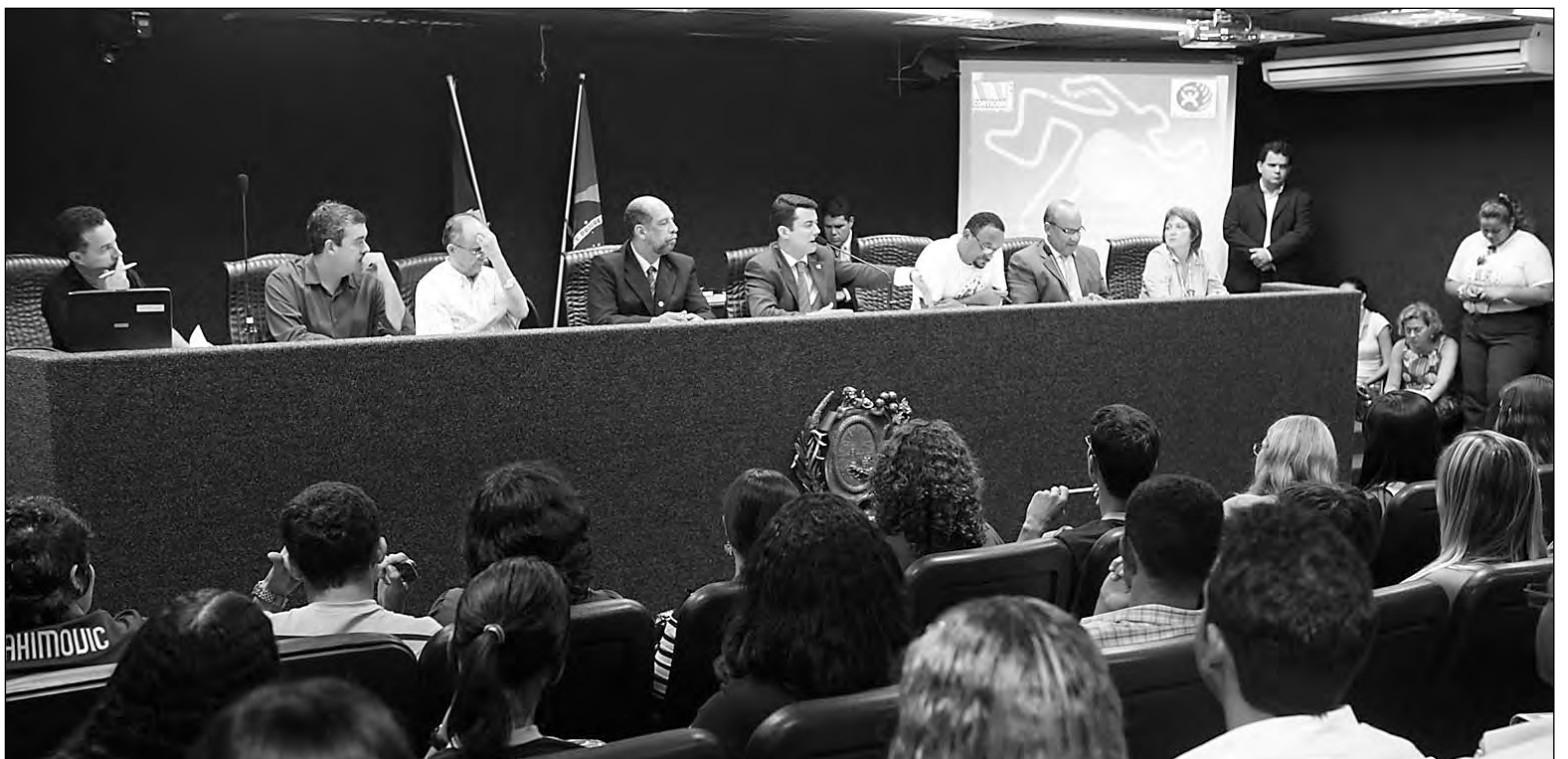
CONSTRUÇÃO CIVIL - Os acidentes nos canteiros de obras do Estado também preocupam colegiado, que debateu assunto em audiência