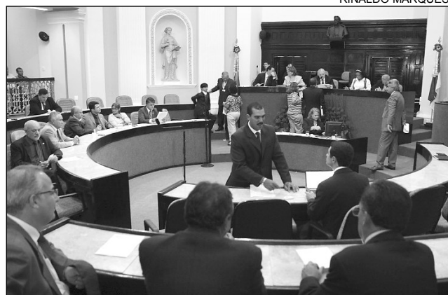
ACORDO - Plenário acatou duas emendas ao projeto de lei

salarial do Poder Executivo. “A matéria beneficia 352 auditores, que passarão a receber mensalmente R$ 23 mil”, observou o tucano.