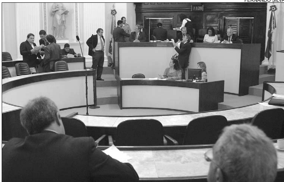
UNANIMIDADE - Plenário volta a analisar matéria hoje em Redação Final

As proposições de nº 1333/06, nº 1356/06 e nº