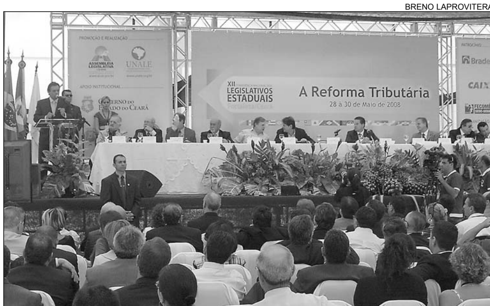
MESA - Presidente Guilherme Uchoa (e) comandou comitiva dos deputados pernambucanos

A conjuntura político-econômica brasileira foi,