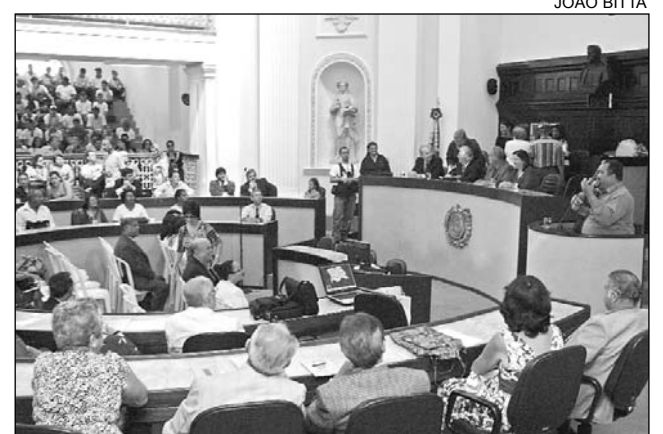
ECLÉTICO - Público também ouviu músicas de Pixinguinha