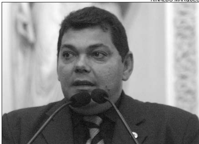
FIGUEIRÔA - Destaque para a geração de empregos

Pequenos comerciantes dependem da aprovação da Reforma Tributária para terem acesso a linhas de créditos e, assim, desenvolverem trabalho mais qualificado. O argumento voltou a ser defendido, ontem, pelo deputado Antônio Figueirôa (PTB). "Há 15 dias, o governador Eduardo Campos (PSB) recebeu a visita do presidente nacional do Serviço de Apoio às Micro e Pequenas Empresas (Sebrae) para dar início à Caravana do Simples Nacional", lembrou.