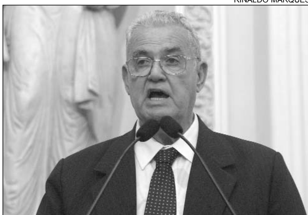
TRAJETÓRIA - Deputado lembrou trabalho em Petrolina