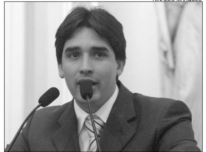
DEBATE - Costa sugeriu mais controle dos gastos públicos