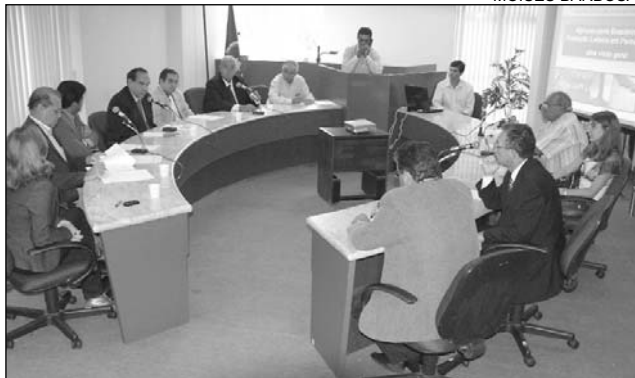
QUEIXA - Representantes do setor querem mais apoio

aos produtores do Estado, que é o mais baixo do Nordeste”, salientou o presidente da Faepe. Guerra elogiou a iniciativa do colegiado em debater o assunto.