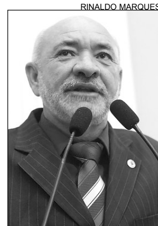
BREVE - Inauguração