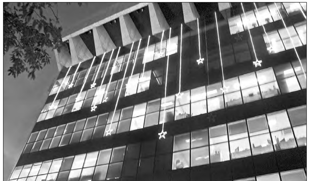
PERNAMBUCO - No Estado, o Tribunal Regional Eleitoral decide sobre questões locais