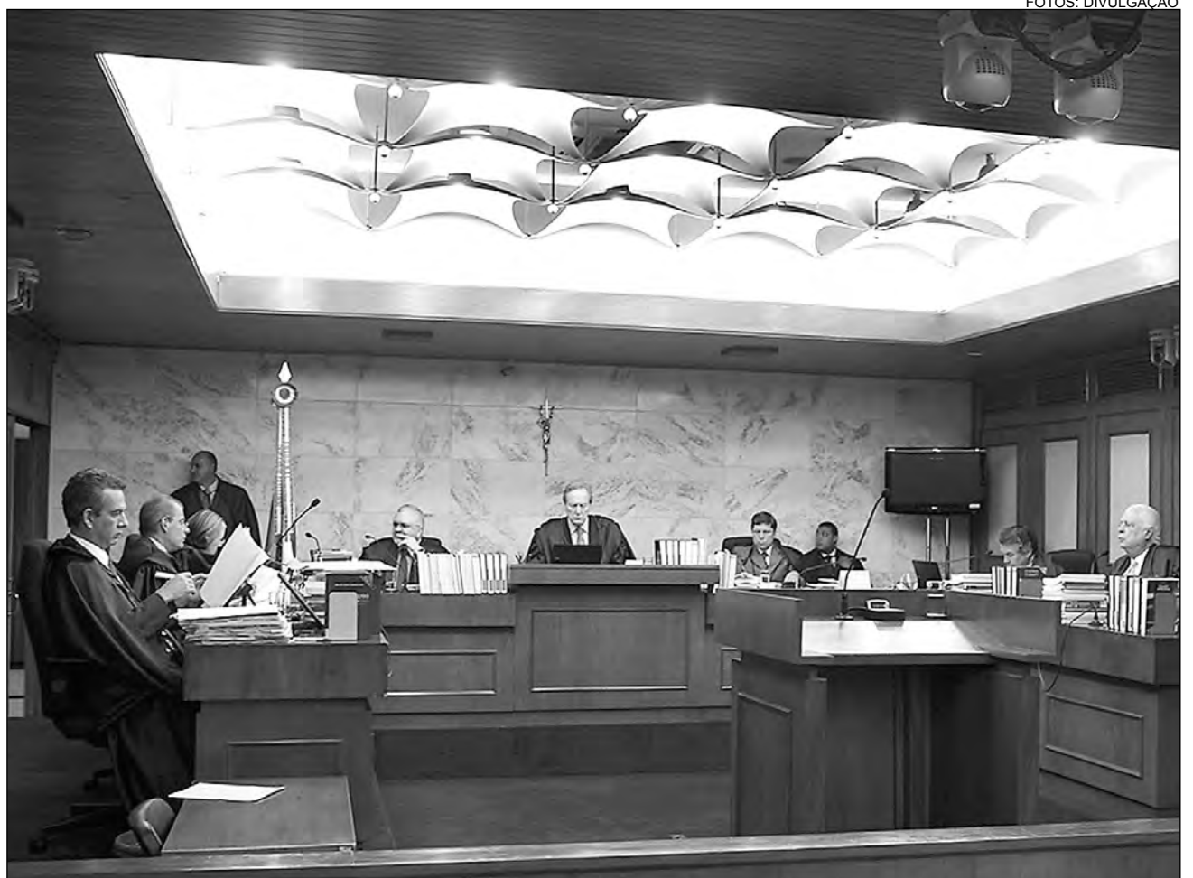
BRASÍLIA - Acima, o registro de uma reunião, no Distrito Federal, entre os que integram o Tribunal Superior Eleitoral

A minirreforma eleitoral também prevê que o eleitor fora do domicílio eleitoral vote em trânsito apenas para presidente da República. O eleitor só poderá efetivar a escolha de seus representantes apresentando o Título de Eleitor e um documento com foto.