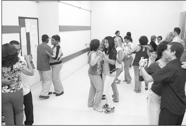
EMBALO - Bolero e swing movimentaram o público