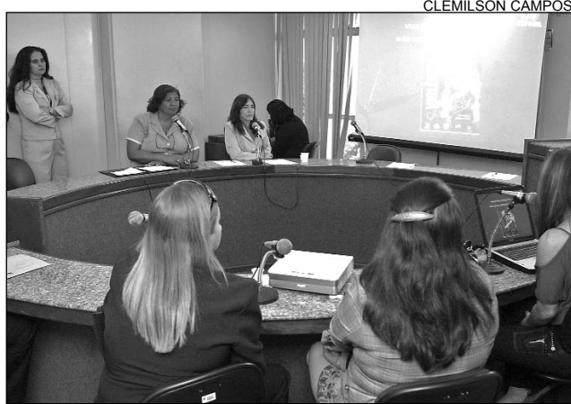
COLEGIADO - Deputadas cobraram providências urgentes

"Além das Delegacias da Mulher, elas podem procurar o Centro Vilma Lessa, a defensoria pública especializada no assunto, em Brasília Teimosa, e os centros