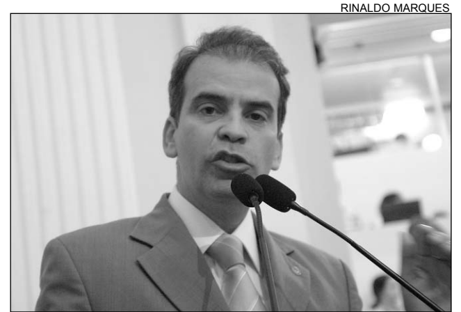
FEITOSA - Parlamentar ressaltou trabalho da instituição

Em apartes, alguns deputados comentaram as críticas feitas, na semana passada, pelo líder da Oposição, Pedro Eurico (PSDB), denunciando a paralisação de postos da PRF. Na ocasião, o deputado relacionou dois acidentes ocorridos na Serra das Russas, no início deste mês, ao excesso de velocidade, às