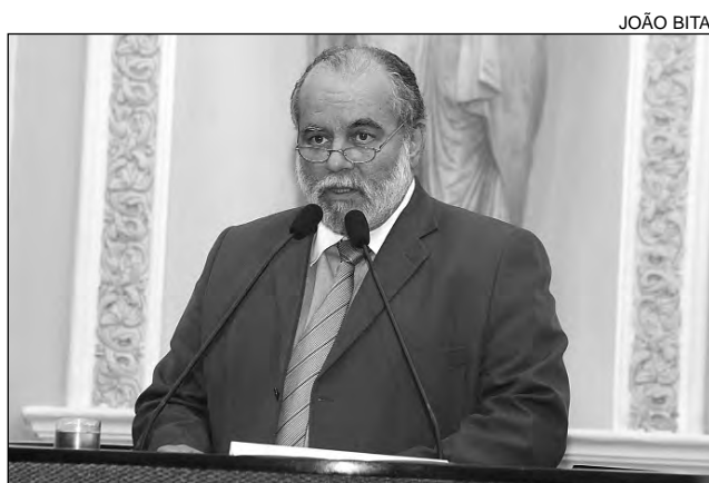
HOMENAGEM - Borges contou história da cidade

escolhidos pelos visitantes, a exemplo da Serra do Giz, “em cujas encostas há desenhos rupestres”; dos monumentos rochosos da cidade; da Barragem de Brotas; da Praça Monsenhor Alfredo Arruda Câmara; e da Catedral Senhor Bom Jesus dos Remédios. “Por toda riqueza histórica, Afogados da Ingazeira merece a homenagem”, reforçou.