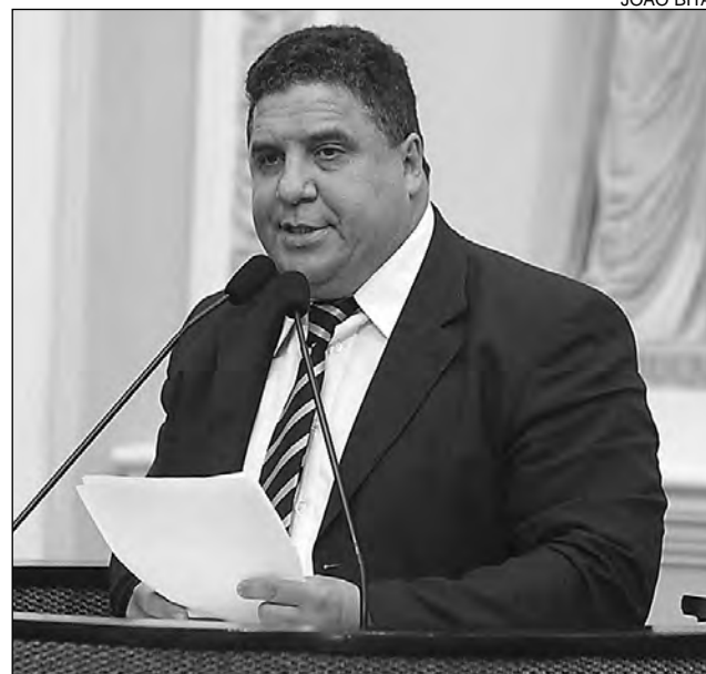
COLLINS - Coordenador da Frente Parlamentar da Família

“É reconhecida como entidade familiar a união estável entre o homem e a mulher. Entende-se, também, como entidade familiar a comunidade formada