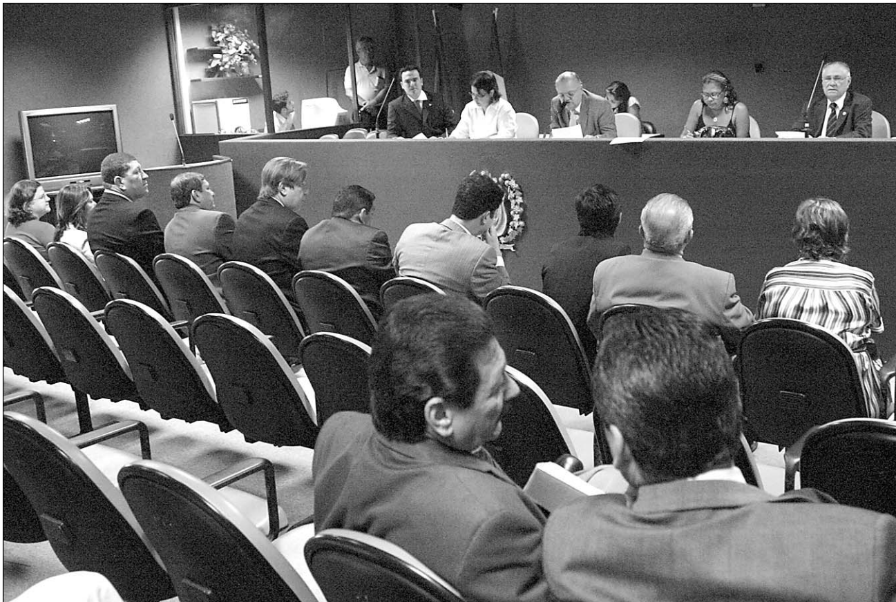
ESFORÇO - Presidente Guilherme Uchoa (mesa) enfatizou empenho das bancadas do Governo e da Oposição

Com a finalidade de constituir um Pólo Automotivo no Estado, a Assembleia Legislativa aprovou, ontem, em redação final, os Projetos de Lei nº 633/08 e de nº 632/08, durante reunião extraordinária. De acordo com o presidente da Alepe, deputado Guilherme Uchoa (PDT), a Casa, mais uma vez, demonstrou responsabilidade ao apreciar, no sábado, duas proposições importantes para o Estado, beneficiando os setores automotivo e de siderurgia. "Não apenas parlamentares da base governista, mas, da Oposição, atenderam ao chamado. Estamos nos últimos dias de convenções político-partidárias, mesmo assim, os deputados levaram em consideração o desafio de contribuir para melhorar a vida da população, aprovando propostas que fortalecerão a geração de emprego e renda", destacou. Ao todo, 28 deputados compareceram à reunião no auditório da Casa.