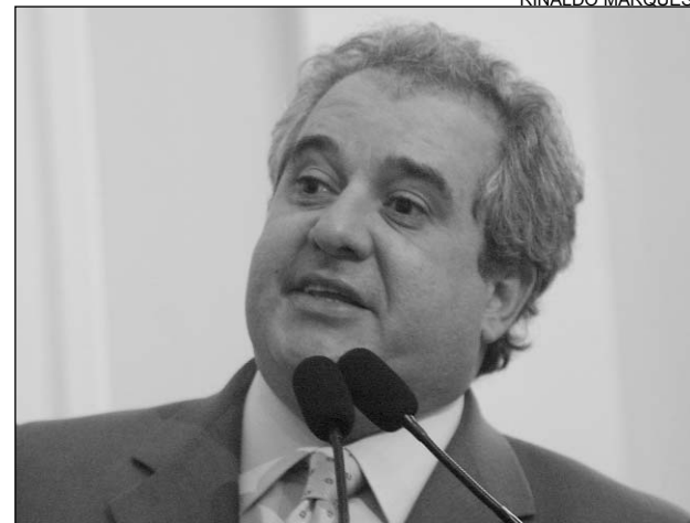
COBRANÇA - Coutinho criticou o governador socialista