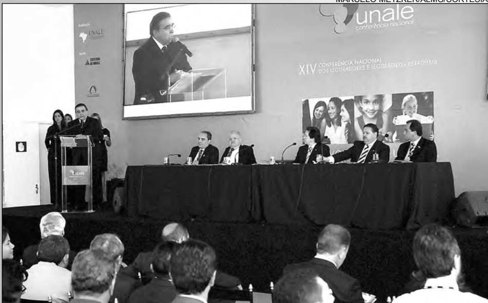
IMPORTANCIA - Representantes de 26 Parlamentos e da Câmara Distrital de Brasília

REDE LEGISLATIVA – Doze entidades realizaram eventos simultâneos à Conferência da Unale, entre elas a Associação Nacional de Procuradores das Assembleias Legislativas e a Associação Brasileira de Cerimonialistas dos Legislativos Estaduais. O encontro da Associação Brasileira de Televisões e Rádios Legislativas (Astral) debateu a experiência da Rede Legislativa Digital, cuja primeira iniciativa engloba a Câmara Federal, o Senado, a TV Assembleia de São Paulo e Câmaras Municipais daquele Estado, reunidos no canal 61, consignado pelo Ministério das Comunicações. Na próxima etapa, o sistema será expandido para outras Capitais: Manaus, Fortaleza, Salvador, Brasília, Belo Horizonte, Rio de Janeiro, Florianópolis e Porto Alegre.