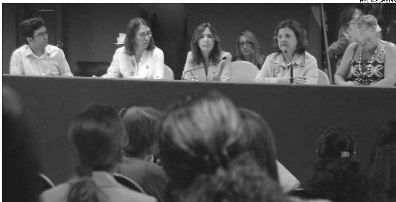
AUDIÊNCIA - Representantes do Executivo e de ONGs participaram do encontro que debateu possíveis soluções