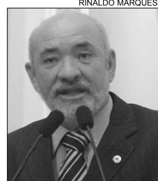
RISCO - Contaminação

O deputado também registrou a matéria publicada no Jornal do Commercio , dia 24, informando que a visita ao matadouro pôde ser feita somente com a in-