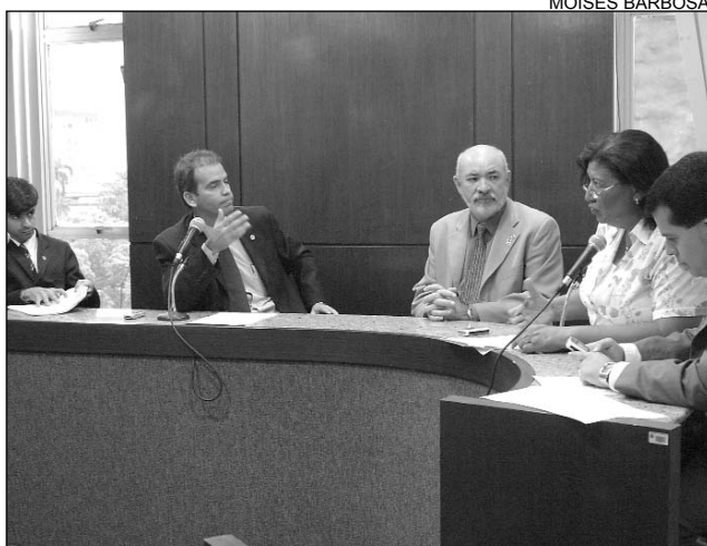
CRIMINALIDADE - Reduzir índices é o grande desafio