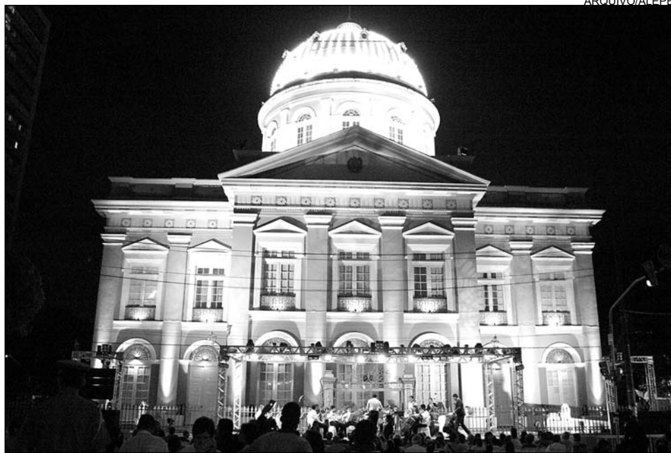
ESPETÁCULO - Lâmpadas e filtros de cor vão ressaltar beleza do Palácio Joaquim Nabuco

Em frente ao Palácio Joaquim Nabuco, 300 cadeiras serão disponibilizadas para que servidores, parlamentares, convidados e o público assistam ao espetáculo. Para a iluminação, serão utiliza-