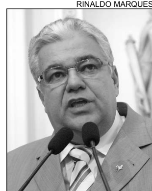
MORAES - Destaque

Durante o encontro, todos os segmentos reivindicaram a elaboração de um projeto, que já foi encaminhado ao Executivo, criando um selo químico para avaliar se o álcool foi produzido legalmente, em Suape, ou se veio de outras usinas. “O selo, desenvolvido em parceria com a UFPE, identifica, por meio de um aditivo, se o produto é