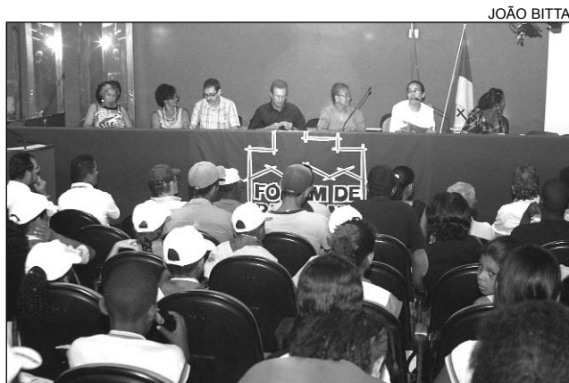
DEBATE - Comissão fez alusão ao Dia Nacional do Rio

“O colegiado está trazendo as autoridades de diversas instituições, como Ministério Público, Agência Estadual de Meio Ambiente e Recursos Hídricos (CPRH), Companhia Independente de Polícia do Meio Ambiente (Cipoma), Instituto Brasileiro do Meio Ambiente e dos Recursos Naturais Renováveis (Ibama), para solicitar que sejam adotadas as medidas necessárias para sanar os problemas”, disse. A socialista ressaltou que algumas ações foram implementadas, mas