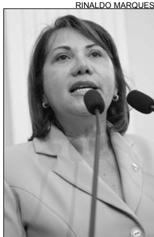
DEMOCRATA - Aprovação

O curso foi criado pela administração municipal, há seis anos, visando ajudar os