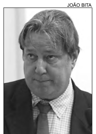
COBRANÇAS - Porto

De acordo com o tucano, há uma placa afixada no local, determinando 120 dias para a conclusão da terraplenagem. “Espero que o gestor público construa, em Moreno, uma barragem nas terras do Engenho Pe-