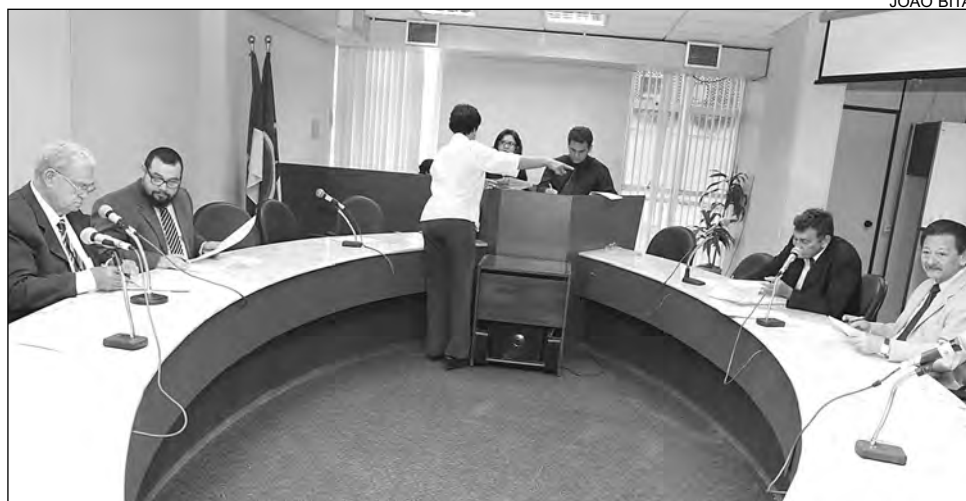
FINANÇAS - Incentivar economia local é o principal propósito da medida acatada

Como observou o Governo do Estado na proposição, o percentual usualmente praticado pela gestão pernambucana é de 17% para automóveis populares e 25% para os de luxo. Caso