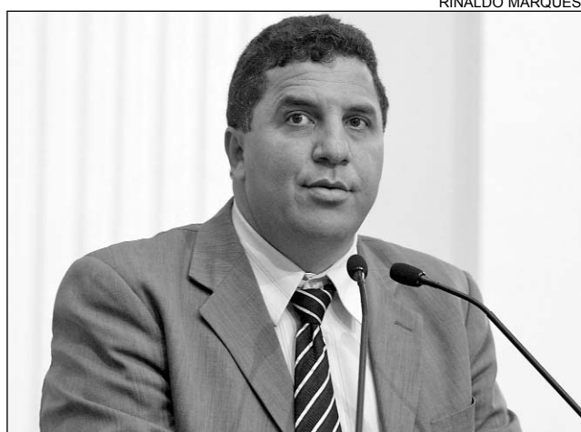
COLLINS - Elogios à atuação do Parlamento pernambucano

Collins agradeceu a presença dos jovens, colégios, Organizações Não-Governamentais (ONGs), Ministério Público, Po-