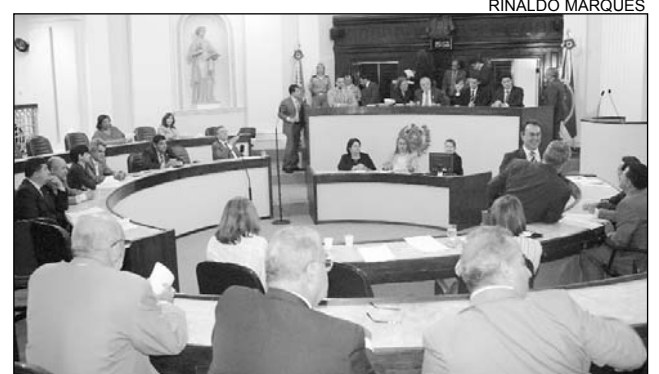
PLENÁRIO - Deputados divulgaram os votos

Dias registrou o apoio da família e dos amigos e ressaltou a luta no STF.