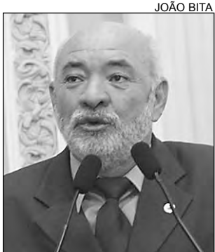
ALEGRIA - Santos

A Barragem de Taquara, localizada em Caruaru, está abastecendo o município de São Caetano, no Agreste. A informação foi repassada, ontem, pelo deputado Esmeraldo Santos (PR). “Ainda não é a solução definitiva para regularizar a falta de água, mas com a nova adutora e a troca da tubulação ainda este ano, conforme garantiu o governador Eduar-