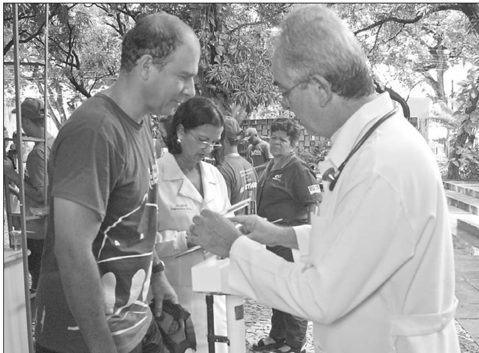
CONTROLE - Médicos aferiram pressão e analisaram taxa de glicose, peso e altura