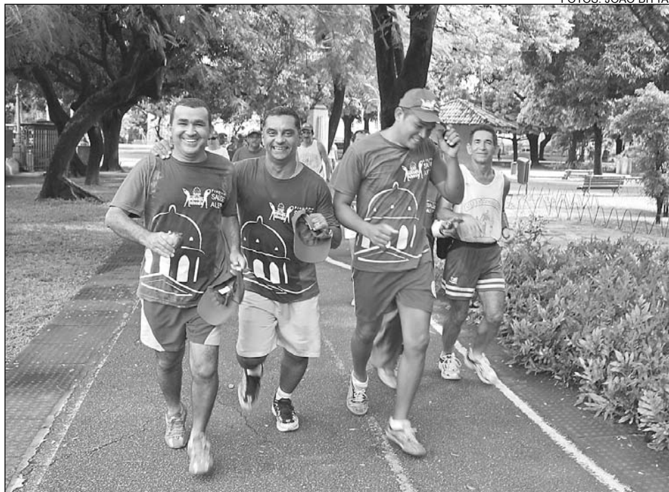
CAMINHADA - No Parque 13 de Maio, os funcionários caminharam por uma hora