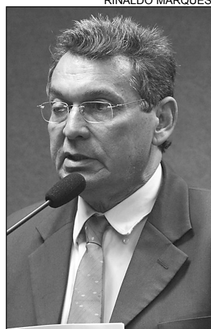
RESISTÊNCIA - Pereira

A Caatinga ocupa grande parte de todos os Estados do Nordeste brasileiro e de Minas Gerais, com uma área total de 750 mil quilômetros quadrados, dos quais apenas 0,65% encontra-se protegida por unidades de conservação. Originalmente,