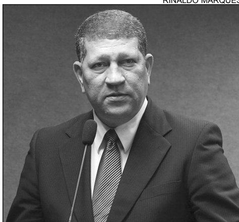
OPINIÕES - Coutinho e Nascimento trataram o tema durante o Grande Expediente