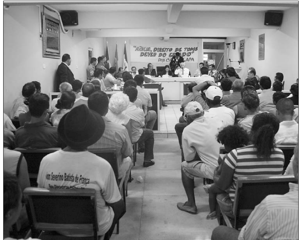
PARTICIPAÇÃO - Prefeitos, vereadores e comunidade fizeram cobranças ao poder público