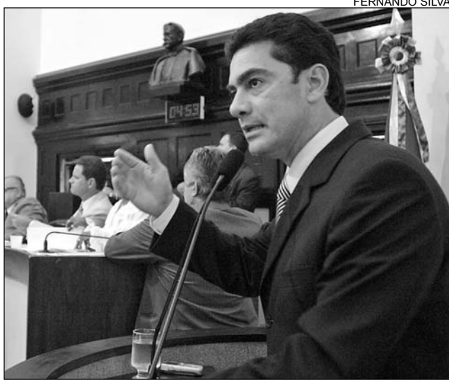
PIMENTEL - Pernambuco integra rota do crime

De acordo com o parlamentar, a atividade ilícita é responsável pela escravidão de mais de 2,4 milhões de pessoas no mundo. "Desse total, 40% dos indivíduos são explorados sexualmente", enfatizou. O tucano chamou atenção para o lucro das redes criminosas com o transporte ilegal de indivíduos. Segundo a OIT, anualmente, são arrecada-