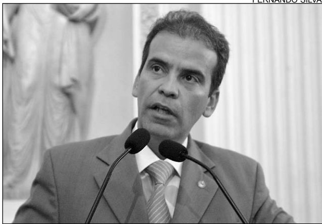
FEITOSA E LEITE - Corporação aguarda a implementação de critérios que resultem na ascensão profissional