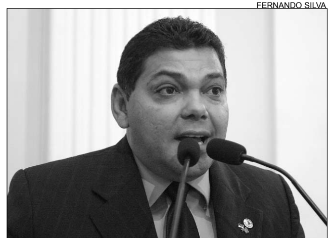
FIGUEIRÔA - Serão 32 projetos no Interior do Estado

"No caso de Santa Cruz do Capibaribe, R$ 550 mil serão destinados à implantação de um centro de beneficiamento de leite, que terá capacidade para tratar 8.500 litros por dia. Um grande avanço para a cidade, pois, atualmente, 90% da extração leiteira é feita por meios rudimentares, sem tratamen-