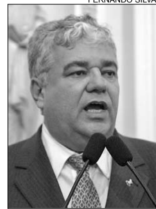
AÇÃO