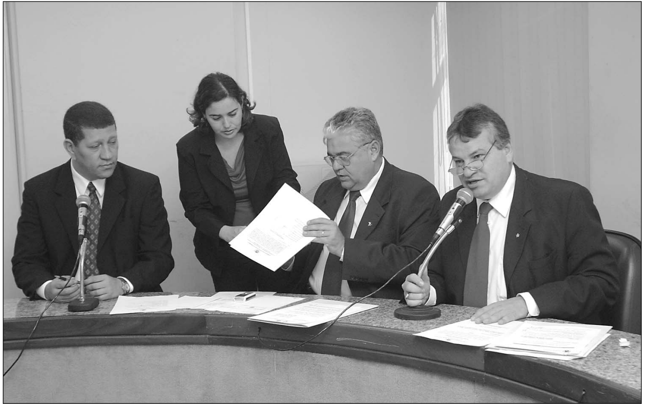
OBJETIVO - Iniciativa visa reduzir déficit habitacional. Estima-se que 387 mil famílias do Estado não possuem casa própria