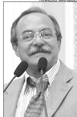
UCHOA E EURICO - Importância do abolicionista

mata. Atuou como um dos fundadores da Academia Brasileira de Letras e se destacou na luta contra a escravidão”, comentou Eurico. Natural do Recife, o abolicionista morreu em 17 de janeiro de 1910, na cidade de Washington (EUA), aos 70 anos de idade.