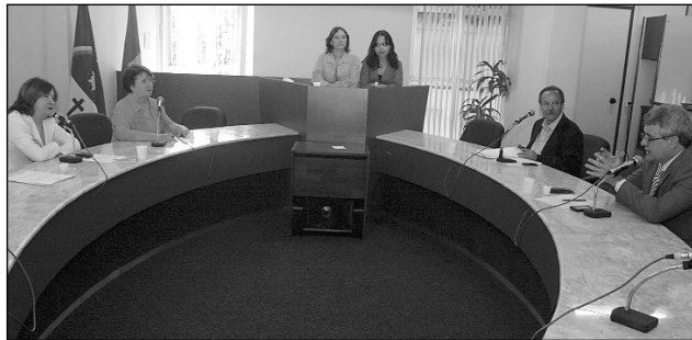
ADMINISTRAÇÃO E CIDADANIA - Deputados aceitaram abertura de crédito devido a impacto positivo da medida