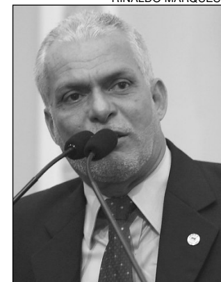
LEITE - Participação