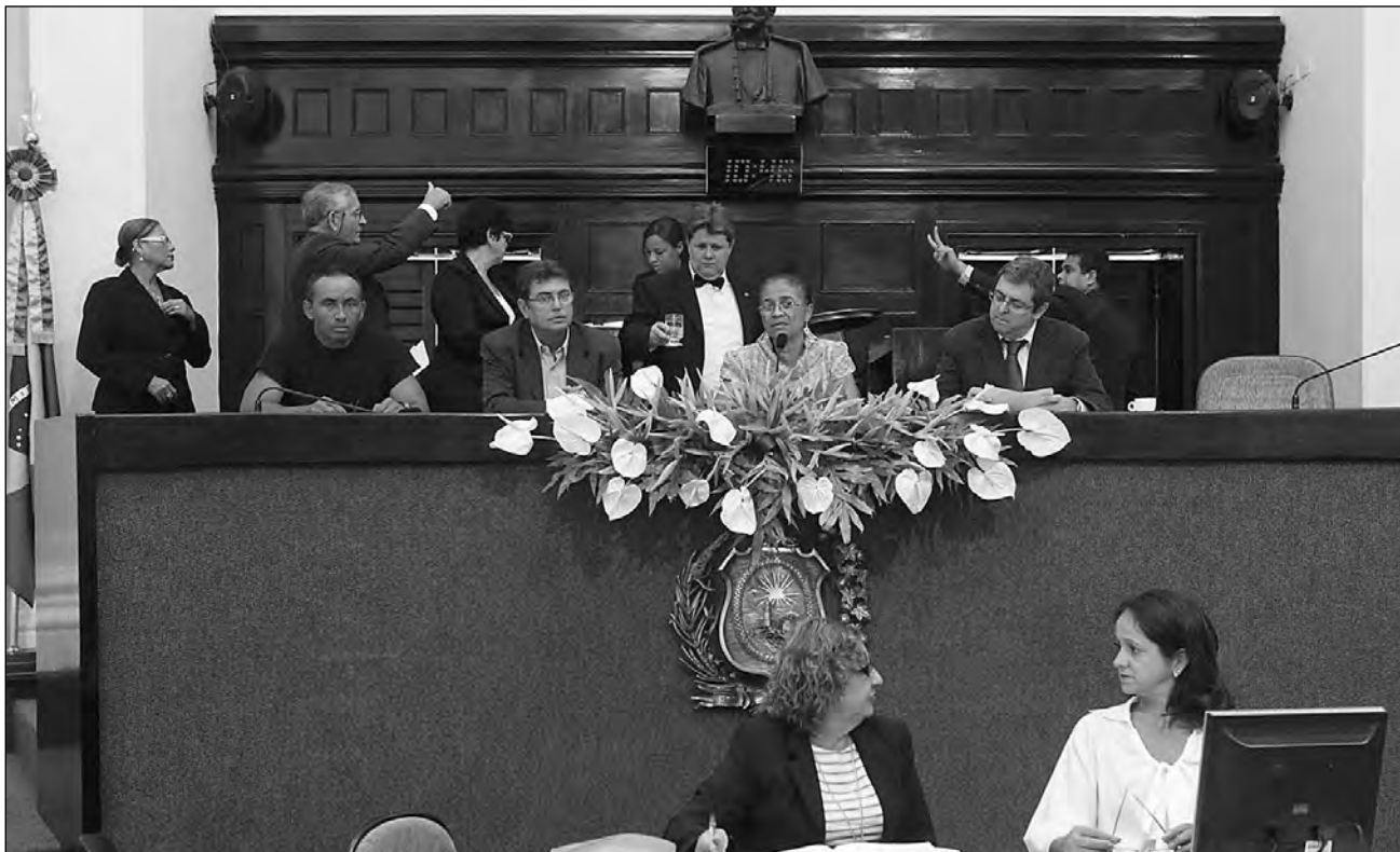
BALANÇO - Comissão avaliou suas ações durante comemorações do Dia Mundial do Meio Ambiente, festejado em 5 de junho

que atingiram a Mata Sul do Estado, no mês passado. A iniciativa contará com o apoio do Executivo e de diversos órgãos da sociedade civil.