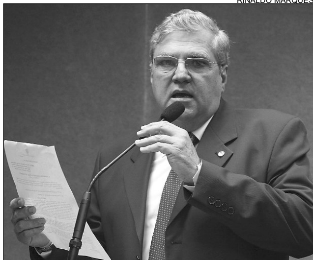
ARGUMENTO - Ênfase na riqueza ambiental do Estado

A matéria será encaminhada para as Comissões de Constituição, Legislação e Justiça e de Meio Ambiente da Alepe, antes de seguir para a análise do Plenário. Se aprovada, a comenda será entregue no mês de dezembro.