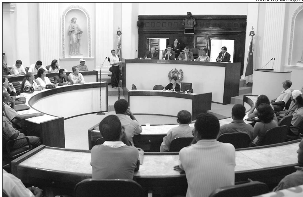
AUDIÊNCIA - Comissões de Defesa do Meio Ambiente e de Cidadania debateram o assunto