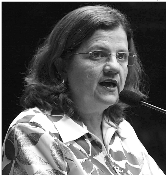
TERESA - Vale-cultura é uma das novidades propostas