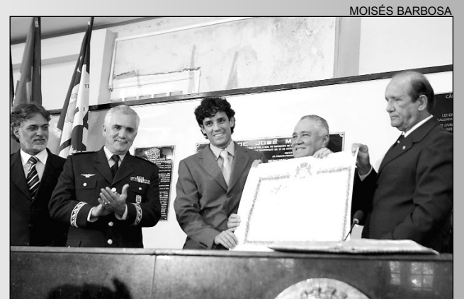
DIPLOMA - Deputado estadual celebra conquista