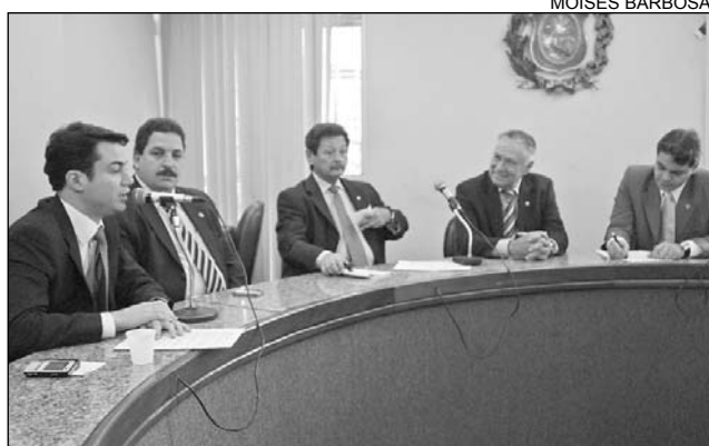
ESPANHA - Extradução de brasileiros está na pauta

O tratamento dado aos brasileiros que desembarcam na Espanha e os grandes empreendimentos internacionais que estão chegando a Pernambuco estarão na pauta de trabalho da Comissão de Negócios Internacionais da Assembleia. Ontem, o colegiado se reuniu para definir os temas a serem abordados este ano. O grupo pretende receber o secretário estadual de Desenvolvimento Econômico, Fernando Bezerra Coelho, para se inteirar sobre