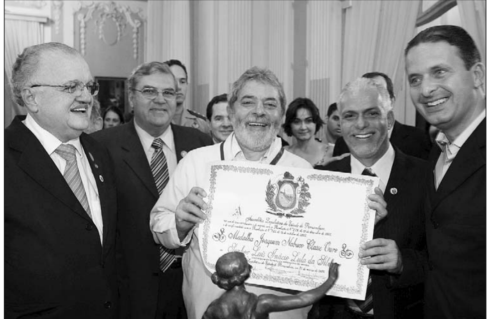
NACIONAL - Emocionado, Chefe do Estado brasileiro (c) agradeceu a condecoração