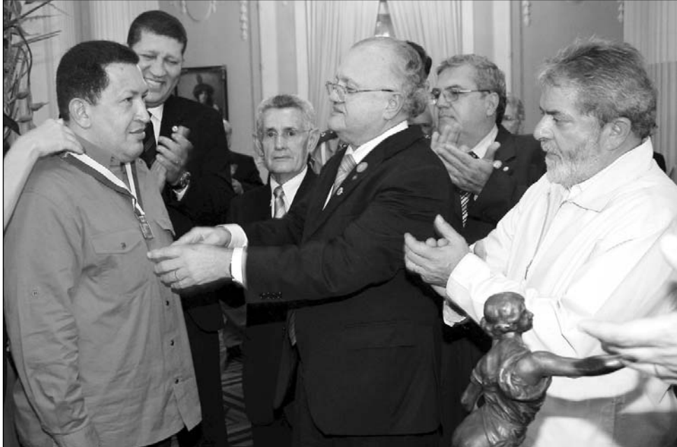
CAMPO DAS PRINCESAS - Presidente da Venezuela foi agraciado por Guilherme Uchoa