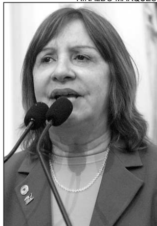
BALANÇO - Terezinha

deputado federal Raul Henry (PMDB-PE). O ministro adiantou que o Governo não abre mão da MP, mas admite a possibilidade de flexibilizá-la. "Existe um conflito de competência entre os poderes municipais e federal. A prerrogativa de legislar sobre os municípios é dos prefeitos. Se o Governo Federal constrói uma estrada que corta uma cidade, terá que obedecer à legislação municipal", argumentou a deputada, acrescentando que existem muitas propostas de emendas à MP tramitando no Congresso Nacional.