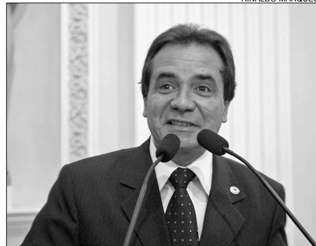
SANTANA - Serão destinados cerca de R$ 5 milhões

Foram destinados cerca de R$ 5 milhões para a concessão das bolsas, o equivalente a 25% do orçamento da Facepe. Segundo o tucano, as áreas com maior apresentação e aprovação de projetos foram as de ciências humanas e sociais, com 82 propostas. "Este fato resgata a liderança que o Estado sempre teve na comunidade científica", frisou, acrescentando que Pernambuco é sede da