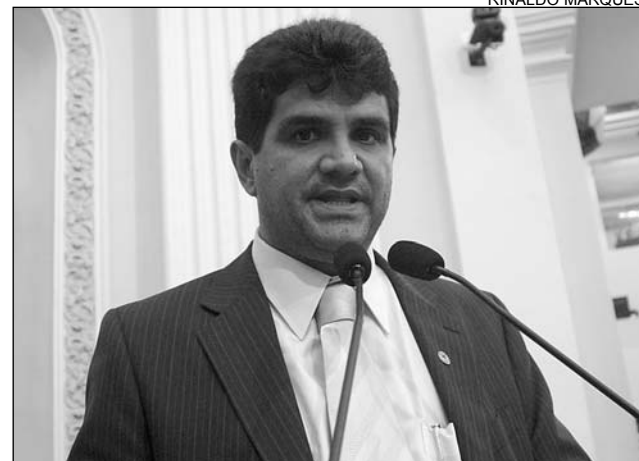
TRANSFERÊNCIA - Garanhuns assumiu administração

As outras entidades estaduais que prestam assistência à Itaíba, como Detran e Compesa, continuam