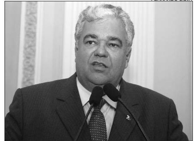
INVESTIMENTO - Moraes quer verbas para segmento