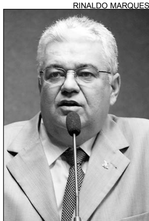
MORAES - Críticas

“A CNH é um instrumento que ajuda o jovem a conseguir emprego. Hoje, o documento custa mais de R$ 400,00 e, em 2009, poderá chegar a R$ 600,00. Como se não bastasse arcar com uma carga tributária tão elevada, somos obrigados a pagar muito por esse serviço