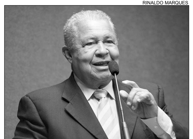
DEMOCRATAS - Deputado citou Duque de Caxias

O dia foi escolhido em homenagem ao nascimento de Luís Alves de Lima e Silva, conhecido como Duque de Caxias, na cidade de Estrela, no Rio de Janeiro. Caxias foi declarado patrono do Exército Bra-